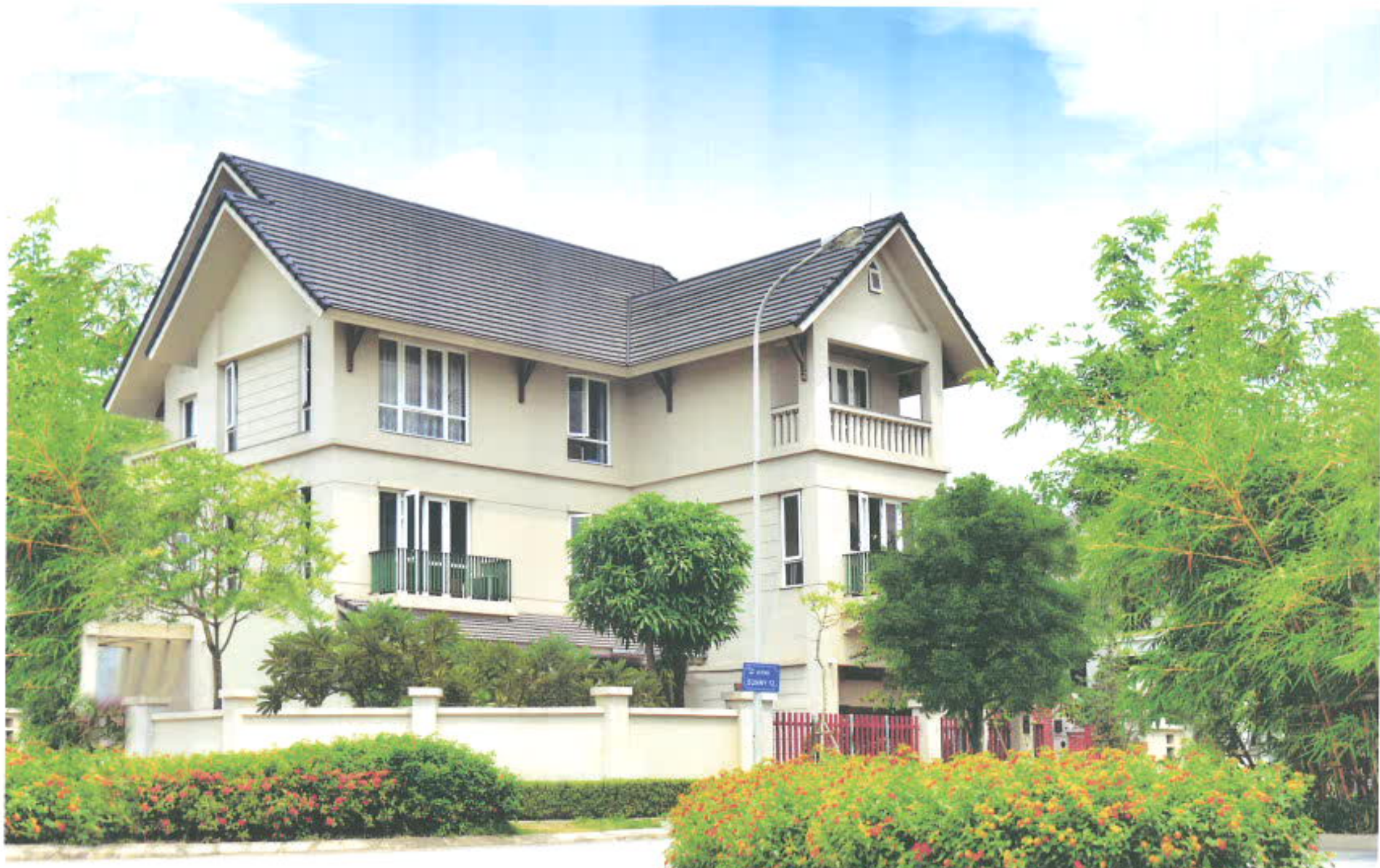
BIỆT THỰ SUNNY GARDEN CITY Quốc Oai - Hà Nội