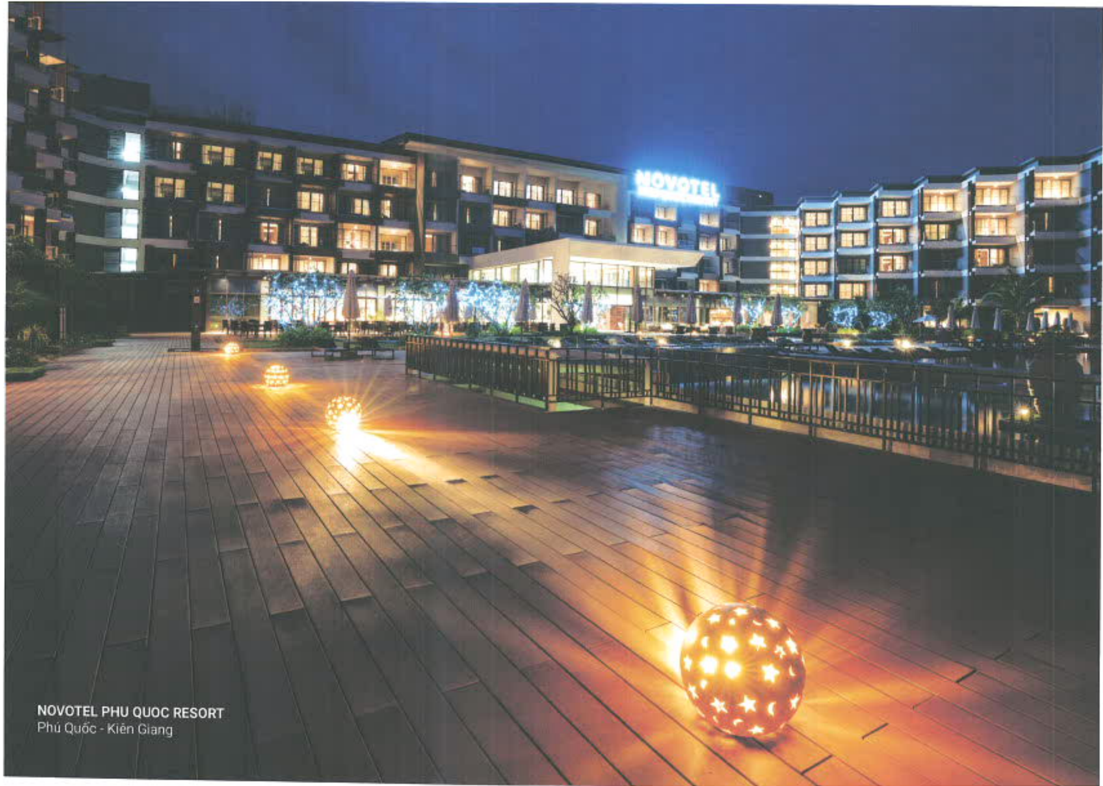
NOVOTEL PHU QUOC RESORT Phú Quốc - Kiên Giang