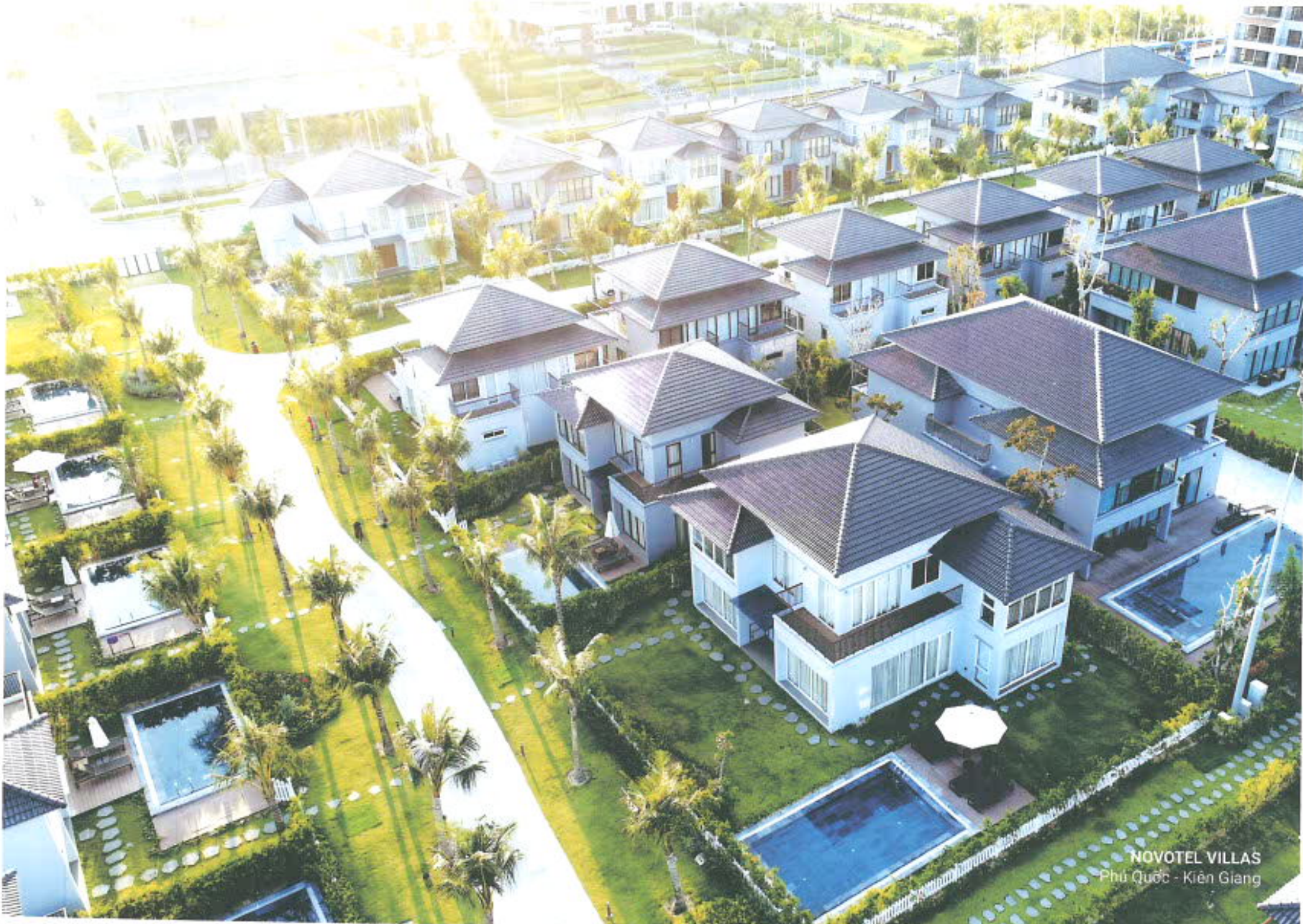
NOVOTEL VILLAS Phú Quốc - Kiên Giang